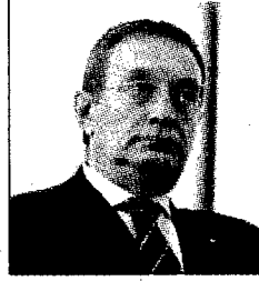
IL GARANTE Il presidente dell' Autorità Antitrust, Antonio Catricalà

Nel mirino gli ordini, le tariffe e gli ostacoli per l'accesso alla professione