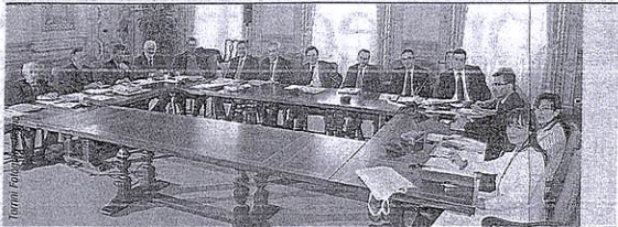
Firenze. Una riunione della nuova Giunta regionale toscana

Ordini e Collegi aderenti al Cup nelle tre regioni del Centro-Nord in cui l'organismo è stato istituito e numero di professionisti iscritti